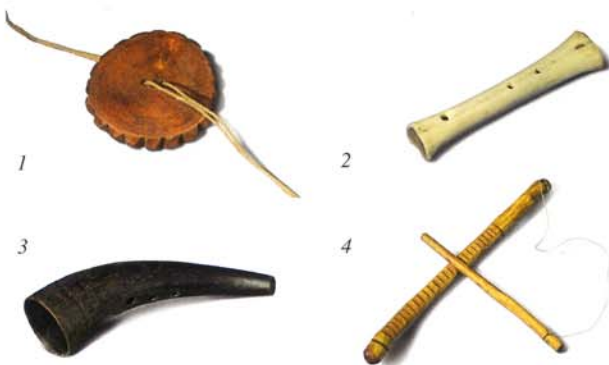
Exempel på fyra olika "hands-on" instrument tillverkade av Åke Egevad. 1) Traditionell snurra av trä. Snarlika forntida föremål av ben har hittats i bl.a. Norge. 2) Benflöjt med två fingerhål. Fynd av sådan benflöjt har gjorts på vikingatida handelsplatsen Birka, Sverige. 3) Kohorn med fingerhål, typmodell av vikingatida fynd från Dalarna. 4) Traditionell träskrapare, använd i Värmland vid jakt på kornknarr. Arkeologiska fynd av träskrapare har gjorts i Polen.

Spanien, Cypern, Tyskland, Skottland, England och Sverige. Respektive land har en institutionell bas och samarbetspartner, vanligen ett universitet, där en eller flera specialister på området musikkarkeologi, är ansvariga för EMAP. I Wien, till exempel, är man specialiserade på antika lyror och rörbladsinstrument och i Paphos, Cypern, är man specialiserade på 3D-scanning av instrument. Därtill ingår ett tjugotal associerade partners med olika inriktningar i sammanhanget, från Galway Early Music Festival, Irland, till Universitetet i Helsingfors.